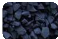
Noir Code : 4639 RAL : 9004