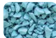
Turquoise Code : 4654 RAL : 5018