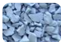
Bleu gris Code : 4610 RAL : 5014