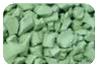
Vert lumineux Code : 4641 RAL : 6017