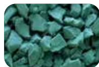
Vert foncé Code : 4646 RAL : 6032