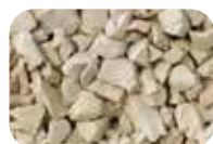
Coquille d'œuf Code : 4624 RAL : 1015