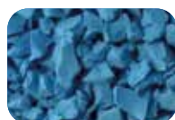
Bleu ciel Code : 4618 RAL : 5015