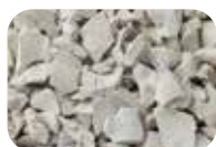
Blanc Code : 4629 RAL : 1013