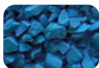
Bleu pétrole Code : 4615 RAL : 5019