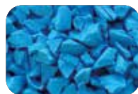
Bleu foncé Code : 4659 RAL : 5017