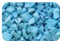
Bleu clair Code : 4658 RAL : 5024