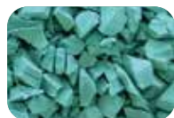
Vert menthe Code : 4640 RAL : 6000