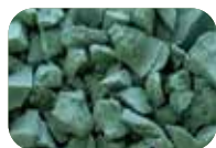
Vert arc-en-ciel Code : 4656 RAL : 6025