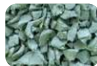
Vert clair Code : 4647 RAL : 6011