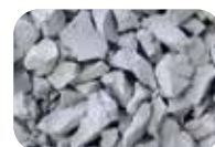
Gris clair Code : 4638 RAL : 7035