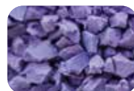
Violet Code : 4634 RAL : 4005