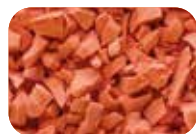
Orange Code : 6657 RAL : 2011