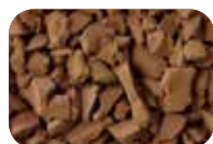
Brun Code : 4628 RAL : 8024