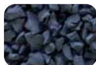
Gris anthracite Code : 4631 RAL : 7015